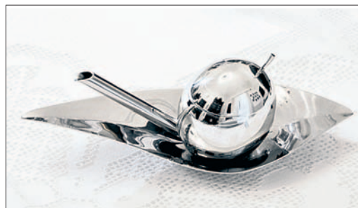
Stilvoll und elegant: der Taste-Huile von Alessi.

von Ölen. Tipp: Das Objekt kurz in den Händen halten, so hat das Öl die richtige Temperatur und kann sein volles Aroma entfalten. Der Taste-Huile kann aber selbstverständlich, nicht zuletzt dank seiner ansprechenden Optik, auch dazu genutzt werden, das Öl direkt über die Speisen zu träufeln. AR